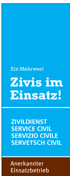
120 x 300 Pixel (Skyscraper ohne Bild) Format: JPG-Datei Link: www.zivi.admin.ch/tb2