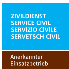
120 x 120 Pixel (Square) Format: JPG-Datei Link: www.zivi.admin.ch/tb2

Institutionen für Betagte und Menschen mit einer Beeinträchtigung, Kinderkrippen, Kinderheime, Jugendhäuser, Institutionen zur Betreuung von Stellenlosen und Obdachlosen, Asylzentren, Institutionen zur Betreuung von Personen mit Suchtproblemen