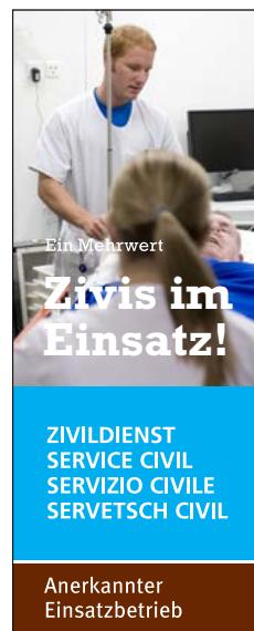
120 x 300 Pixel (Skyscraper mit Bild) Format: JPG-Datei Link: www.zivi.admin.ch/tb1