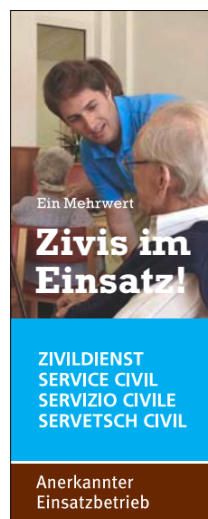
120 x 300 Pixel (Skyscraper mit Bild) Format: JPG-Datei Link: www.zivi.admin.ch/tb2