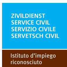
120 x 120 pixel (quadrato) Formato: JPG Link: www.zivi.admin.ch/aa1

Ospedali, cliniche psichiatriche, centri di cura