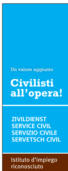
120 x 300 pixel (skyscraper senza immagine) Formato: JPG Link: www.zivi.admin.ch/aa1