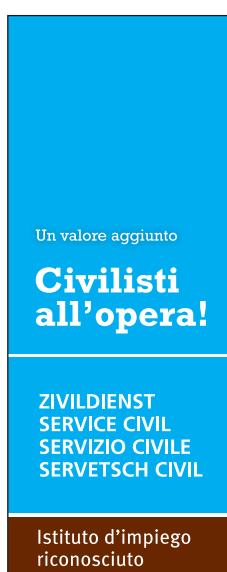
120 x 300 pixel (skyscraper senza immagine) Formato: JPG Link: www.zivi.admin.ch/aa2