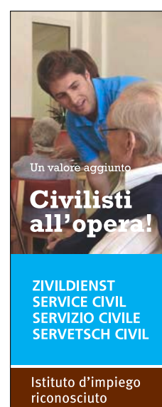
120 x 300 pixel (skyscraper con immagine) Formato: JPG Link: www.zivi.admin.ch/aa2