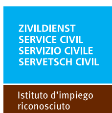
120 x 120 pixel (quadrato) Formato: JPG Link: www.zivi.admin.ch/aa2

Case per anziani e centri per disabili, asili nido, centri infantili o giovanili, istituti di assistenza a disoccupati e senza tetto, centri di asilo, istituti di assistenza a persone con problemi di dipendenza