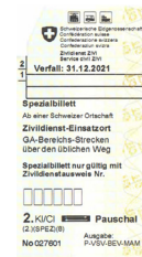
Biglietto speciale (da convalidare)

Se il civilista alloggia presso l'istituto d'impiego riceve altri biglietti speciali (da convalidare, v. figura qui a fianco) per effettuare spostamenti settimanali gratuiti tra il luogo d'impiego e il luogo di domicilio. Questi biglietti devono essere richiesti con la convenzione d'impiego. Saranno inviati per posta. Il biglietto speciale deve riportare il numero del civilista. I biglietti speciali sono validi solo se accompagnati dalla tessera di legittimazione del servizio civile (in formato digitale sullo smartphone o stampato), devono essere convalidati prima della partenza ed esibiti su richiesta.